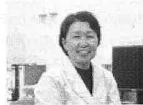
東光(株) 開発研究部部長 (徳島県徳島市)

東光(株)は靴下製造工場です。下肢静脈瘤・リンパ浮腫・エコノミークラス症候群で知られる、肺血栓塞栓症予防用などの下肢静脈還流を促す、医療用ストッキングの開発をしています。当社に入る前はスポーツシューズやウェア、特にフィットネス関連用品の輸入販売に携わっていました。一般の健康な人をゼロと位置づけた時、スポーツやフィットネス関連製品は、積極的に健康を得ようとする人から記録を目指すトップアスリートまで、プラスのレベルが求められています。