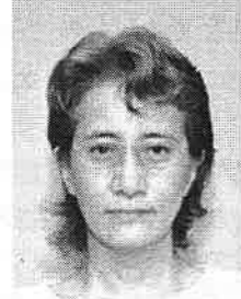
フォトグラファー (東京都練馬区)

早いもので、新体操を撮り始めて今年で25年になります。国内の競技会から世界選手権・オリンピックまでの撮影をしているのですが、この春、国連支援交流協会北関東支部主催「日中交流新体操芸術競技会」の撮影で、北京に行く機会を得ました。本来、新体操の魅力は女性らしい動きの美しさだったと思うのですが、大幅なルール改正により、「美しい・素敵な競技」というより「凄い競技」になってしまったと正直、残念に思っています。