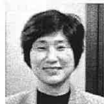
元日本女子プロゴルフ 協会理事 (東京都目黒区)